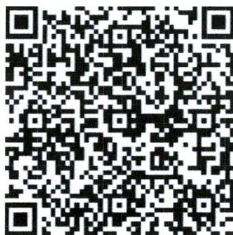
图1 2021年高校实验室安全管理研讨会-线下二维码